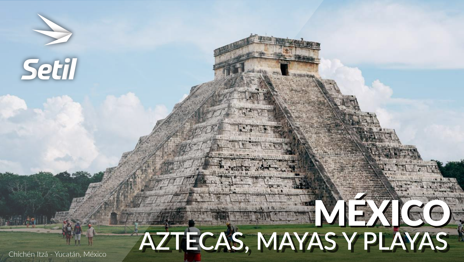
Chichén Itzá - Yucatán, México